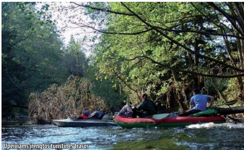
Upeiviams įrengtos turistinės trasos