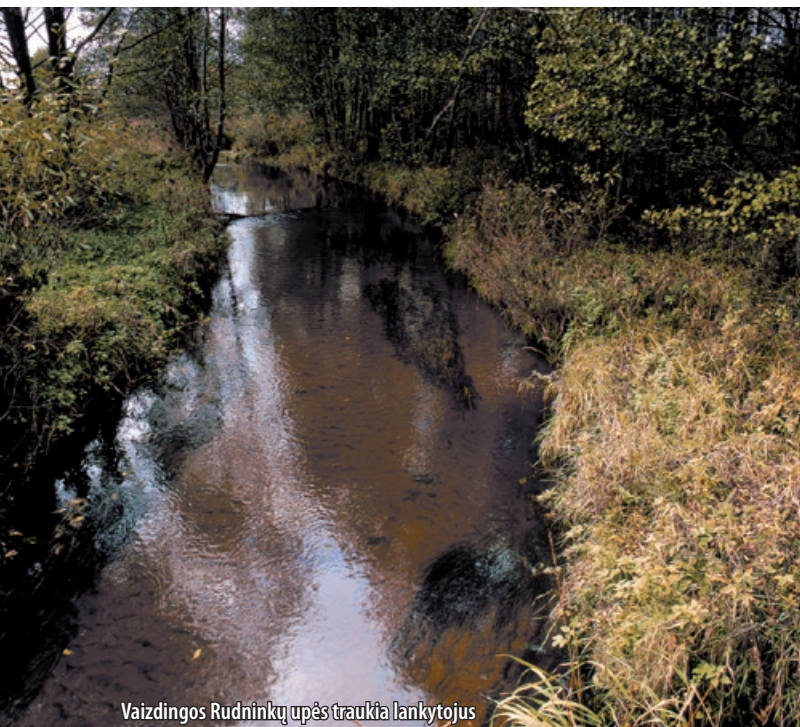
Vaizdingas Rudninkų upės traukia lankytojus

1511 m. vietoj sudegusio medžioklės dvaro pastatyti treji rūmai. Juos šalia esančių kūdrių ant aukštų pamatų surentė iš stambių pušų. Pagrindinis pastatas, apsupty Merkio, stovėjo ant mažos kalvos. Šiaurinėje pilies dalyje buvo kūdra, sujungta perkasu su upe, iš kurios ir semtas vanduo. Šių rūmų paskutiniajame aukšte buvo karaliaus kambariai. 1554 m. gegužės mėnesį viename iš jų Žygimantas Augustas pašarvojo savo antrosios žmonos Barbaros Radvilaitės palaikus, kai, pervežant juos iš Krokuvos į Vilnių, laukė, kol Vilniaus Katedroje bus įrengta vieta laidojimui.