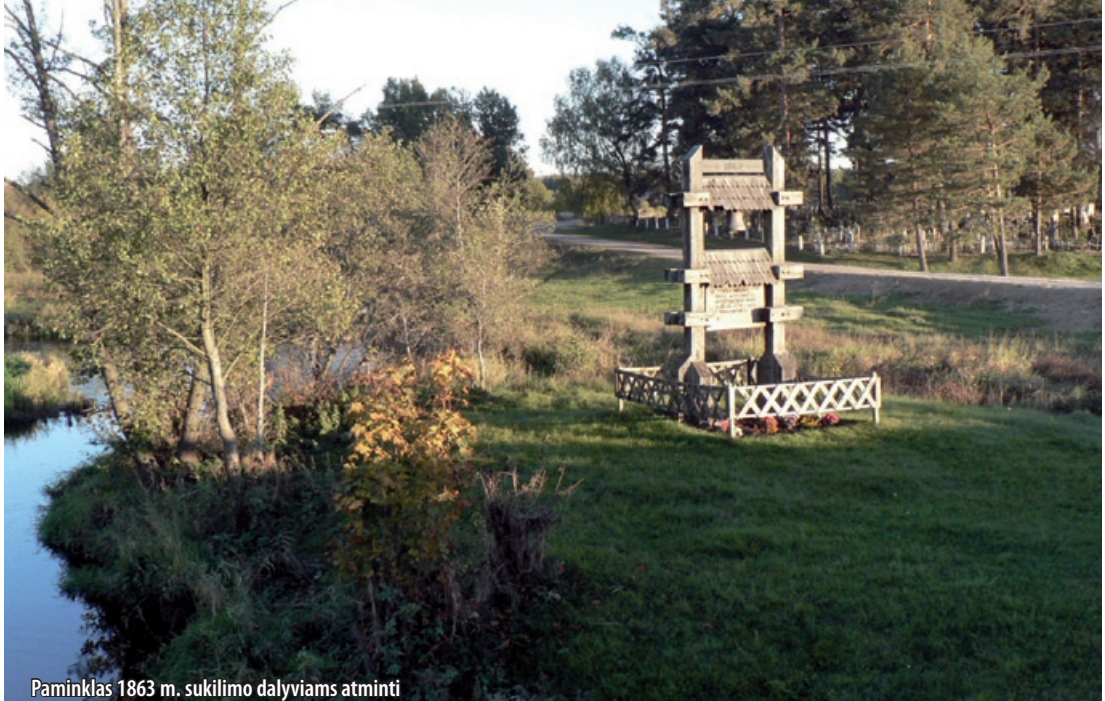
Paminklas 1863 m. sukilimo dalyviams atminti

kalves, dirbtuves. Rūdninkų giria ir gyvenvietė buvo prie pagrindinio vieškelio, kuris nuo senų laikų jungė dvi bendros valstybės sostines – Vilnių ir Krokuvą. Rūdninkų giria buvo nepaprastai tinkama vieta karališkoms medžioklėms. Rūdninkai, įkurti